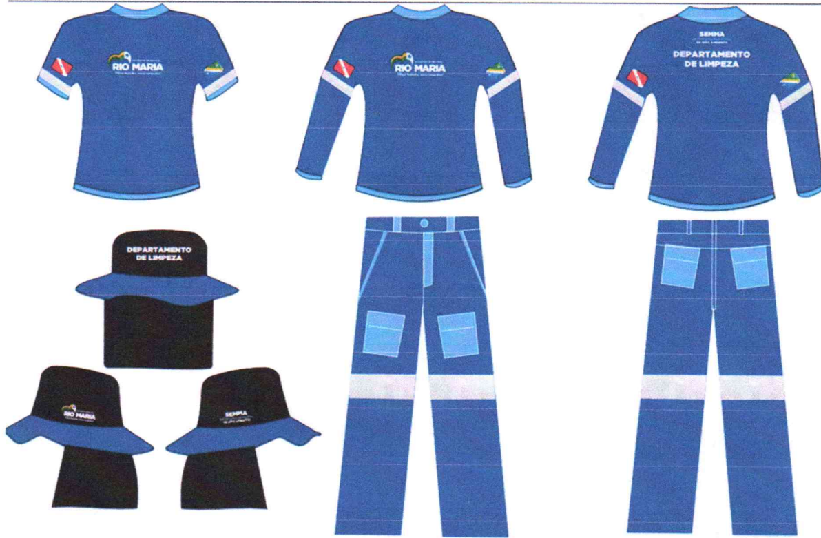
MODELO DE UNIFORME DEPARTAMENTO DE LIMPEZA